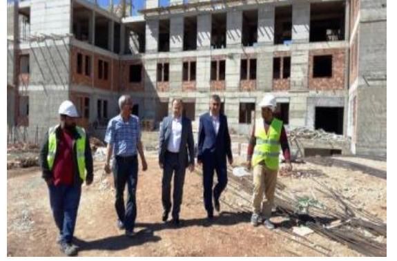
Okul Binası İnşaatı