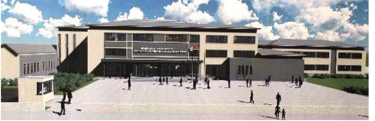
Okul Binası İnşaatı

12 Derslikli Enerji SA Tufanbeyli Mesleki ve Teknik Anadolu Lisesi Okul Binası için yapılan inşaat işleri ; Construction Works for Enerji SA Tufanbeyli Vocational and Technical Anatolian High School Building