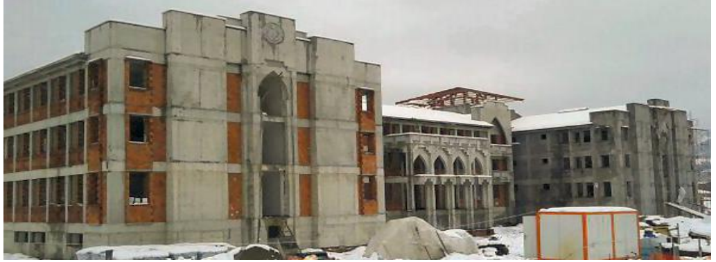
Okul Binası / Devrek – ZONGULDAK

School Construction Works for Housing Development Administration of Turkey (TOKİ)