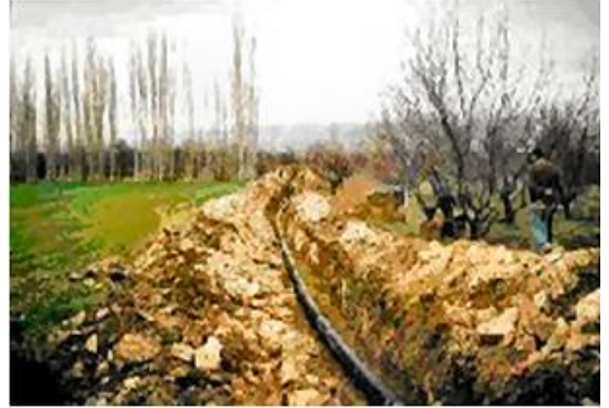
Altınova-Hersek Yalova 15. Bölge Geçici İskan Konutları İçme suyu ve Kanalizasyon İnşaatı Water Transmission Line and Sewer Construction for Temporary Housing Site 15 in Altınova-Hersek Yalova