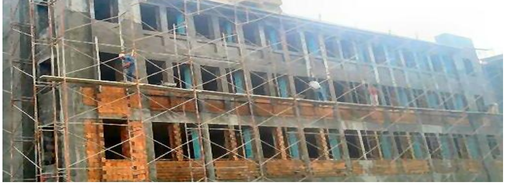
Okul Binası / Kurşunlu ÇANKIRI

School Construction Works for Housing Development Administration of Turkey (TOKİ)