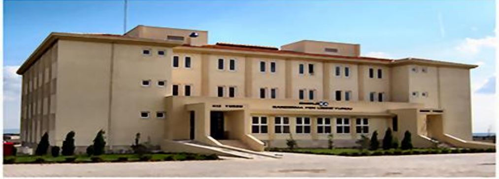
Öğrenci Yurdu Binası / Bandırma - BALIKESİR Dormitory Building / Bandırma - BALIKESİR