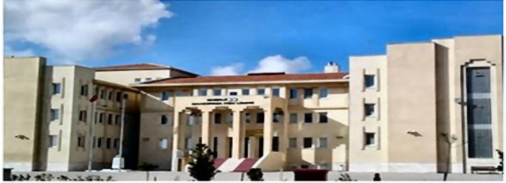
Lise Binası / Bandırma - BALIKESİR High School Building / Bandırma - BALIKESİR