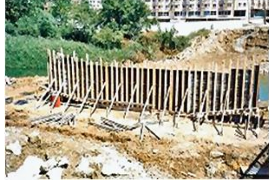
Dim Çayı Köprüsü / Alanya