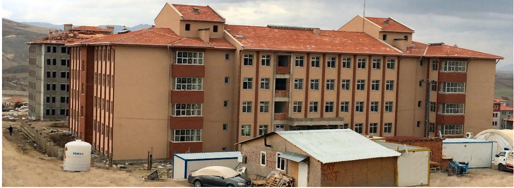
Okul Binası / Kurşunlu ÇANKIRI

School Construction Works for Housing Development Administration of Turkey (TOKİ)