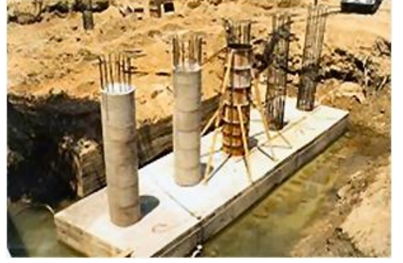
Serapsuyu Köprüsü / Alanya