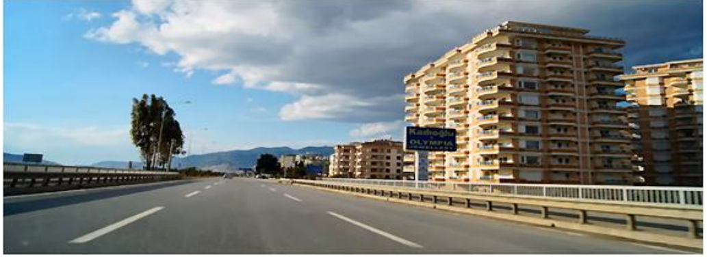
Dim Çayı Köprüsü / Alanya