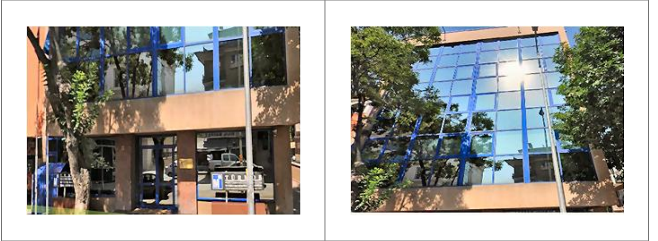
Genel Merkez Ofisi İnşaatı Construction of Headquarters Building of TURMOB