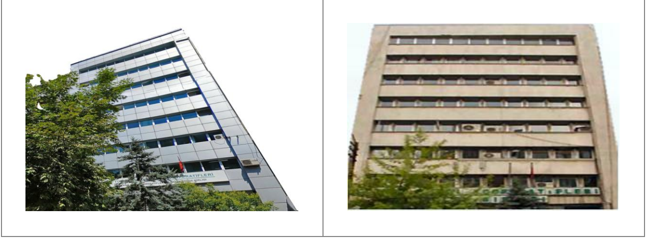
İnşaat, Bakım ve Onarım İşleri / ANKARA Construction, Maintenance and Repair Works / ANKARA