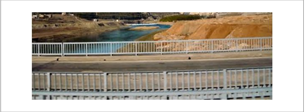
Ilıca Köprüsü / Manavgat