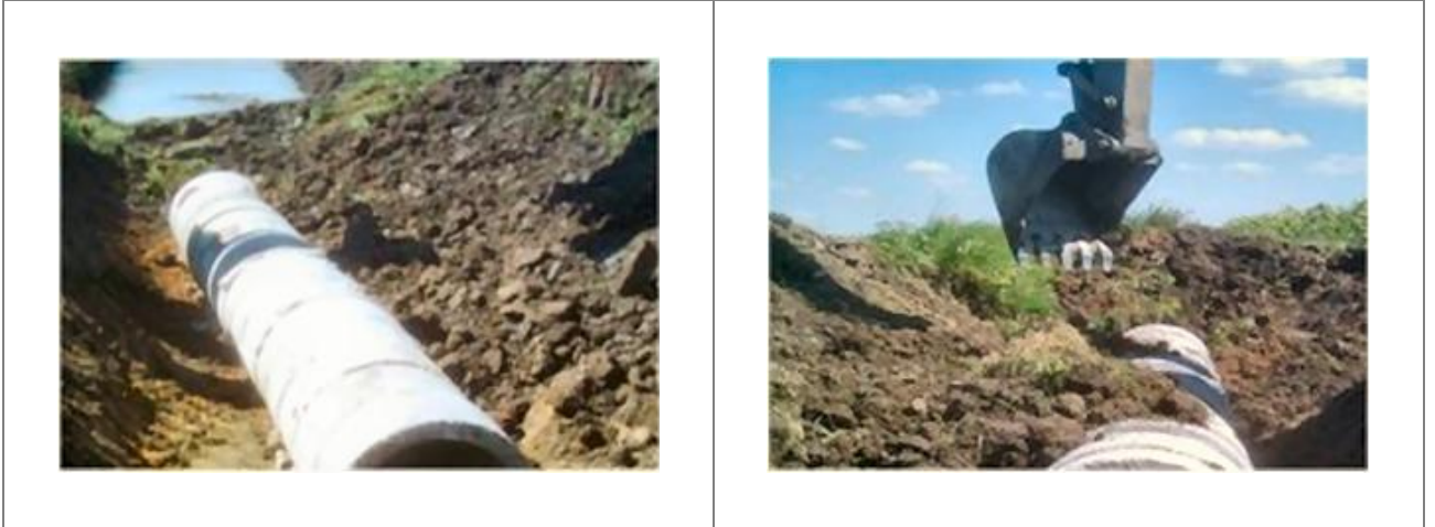
Kanalizasyon İnřaatı / ANKARA

Construction Works for Turkish Land Forces