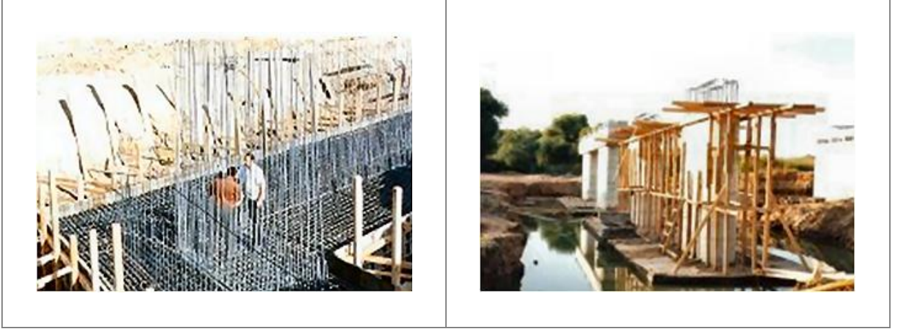
Ilıca Köprüsü / Manavgat