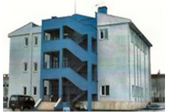
Hizmet Binası / Bandırma – BALIKESİR