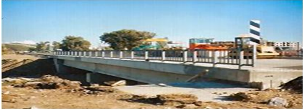
Serapsuyu Köprüsü / Alanya