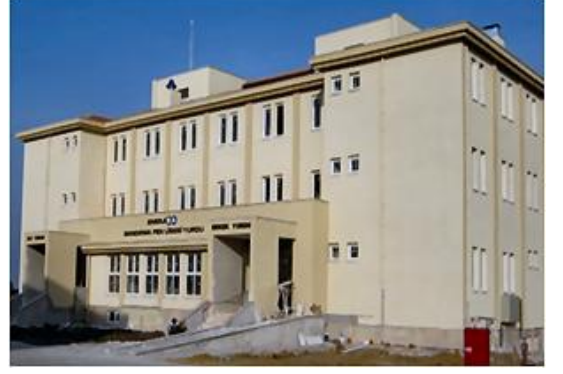
Öğrenci Yurdu Binası / Bandırma - BALIKESİR Dormitory Building / Bandırma - BALIKESİR