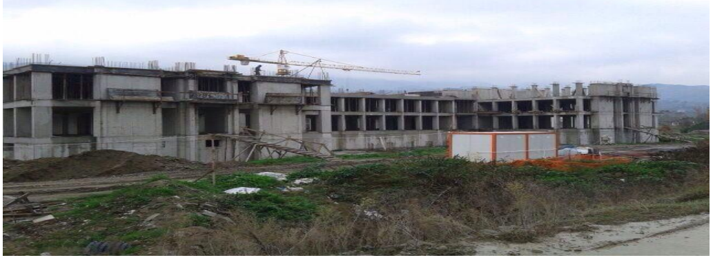
Okul Binası / Devrek – ZONGULDAK

School Construction Works for Housing Development Administration of Turkey (TOKİ)