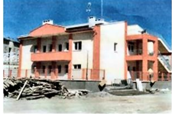
Hizmet Binası / SIVAS