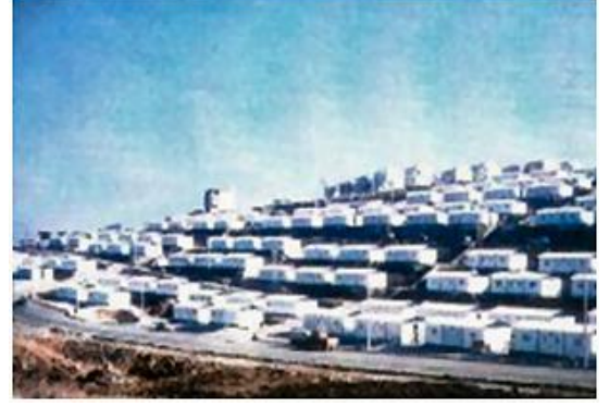
1544 Adet Prefabrik Konut İnşaatı Prefabricated Housing Construction (1544 Pcs.)