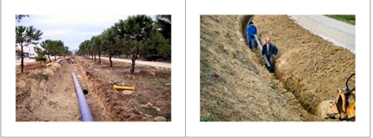
Su İsale Hattı / ANKARA

Construction Works for Turkish Land Forces