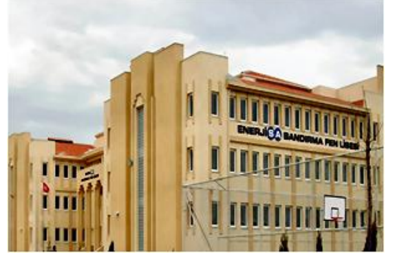
Lise Binası / Bandırma - BALIKESİR High School Building / Bandırma - BALIKESİR